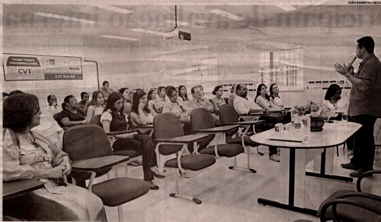
1ª Semana Interna de Prevenção de Acidente no Trabalho (Sipat) acontece até quinta-feira (24)

“A proposta do governo é de se aproximar dessas instituições que trabalham com a qualificação profissional. Por isso, é fundamental a participação da prefeitura em iniciativas como essa da Faetec, que lida com jovens, que são o futuro da economia. A Sipat é uma ação que prepara os estudantes para a consciência do desenvolvimento sustentável. Nossa região está em constante crescimento, porém, temos que nos preocupar