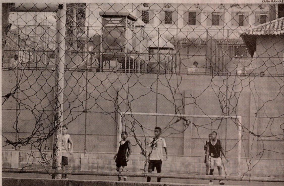
Caso os serviços não sejam 100% concluídos, população pensa em tomar a iniciativa

Segundo eles, área de lazer do bairro ainda apresenta diversos problemas estruturais